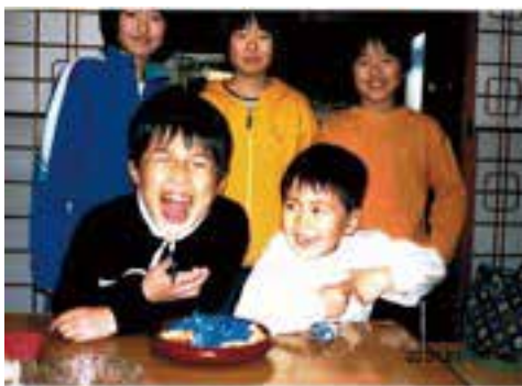
(中学生から園児まで5人の子供たち)

全く見てもらえなかったことにショックを受けました。しかし、ここは我慢して諦めずに再度行つたのですが、最後に