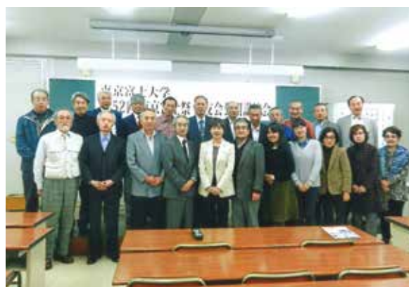
(第52回東京富士祭 校友会公開講演会)