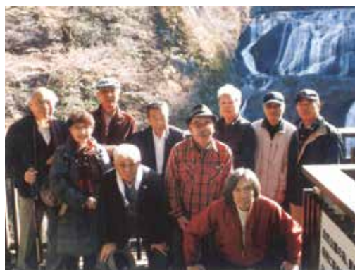
東京富士大学 少林寺拳法OB会 平成29年11月旅行