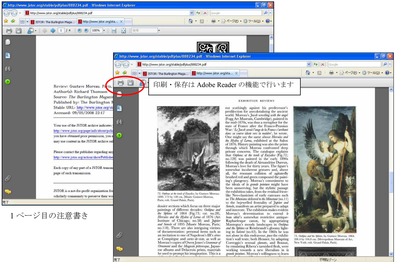
PDF 本文表示 (例: The Burlington Magazine)

ポップアップウィンドウの OK をクリックすると、イメージファイルのダウンロードが始まり、Adobe Reader が起動します。別ウィンドウで PDF イメージを表示します。JSTOR の PDF 表示では、最初の 1 ページ目に 利用に関する注意事項を記載したページが表示され、2 ページ目から本文が表示されます。